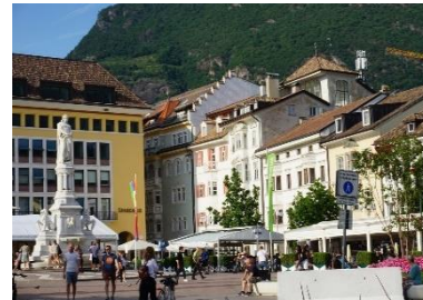
Hauptplatz Bozen

VORMITTAG: Eine Bergstraße führt hinauf aufs Bozener Hochplateau, dem Ritten, mit den schönsten und höchsten Erdpyramiden Europas MITTAGSPAUSE in Bozen NACHMITTAG: frei verfügbare Zeit in Bozen – Eheerneuerungsfeier Festliches Abendessen, Nächtigung in Bozen