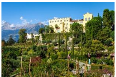
Gärten von Schloss Trauttmansdorf

VORMITTAG: Die Reise führt in den Vinschgau zum bekannten Reschensee Stadtführung im mittelalterlichen Glurns, der kleinsten Stadt in den Alpen, danach MITTAGSPAUSE in Glurns NACHMITTAG: Besichtigung des Klosters Marienberg mit seinem Museum Abendessen und Nächtigung in Bozen