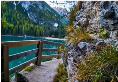
Wanderweg am Pragser Wildsee