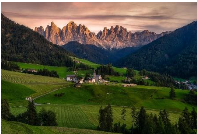
Dolomiten Südtirol

06.00 Uhr Abfahrt in Graz, Frühstück an einer Raststätte MITTAGSPAUSE beim Pragser Wildsee Weiterfahrt durchs Pustertal nach Brixen: Besichtigung des Doms von Brixen mit den Deckenfresken von Paul Troger ABEND: Zimmerbezug im ***Hotel Chrys in Bozen für die nächsten 5 Nächte