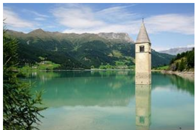
Kirche unter dem See (Vinschgau)

VORMITTAG: Rundfahrt im Herzen der Dolomiten - über Kastelruth zur MITTAGSPAUSE in St. Ulrich im Grödnertal NACHMITTAG: über die Passstraße des Sellajochs geht es weiter nach Canazei und über den Karerpass zum Karersee Abendessen und Nächtigung in Bozen