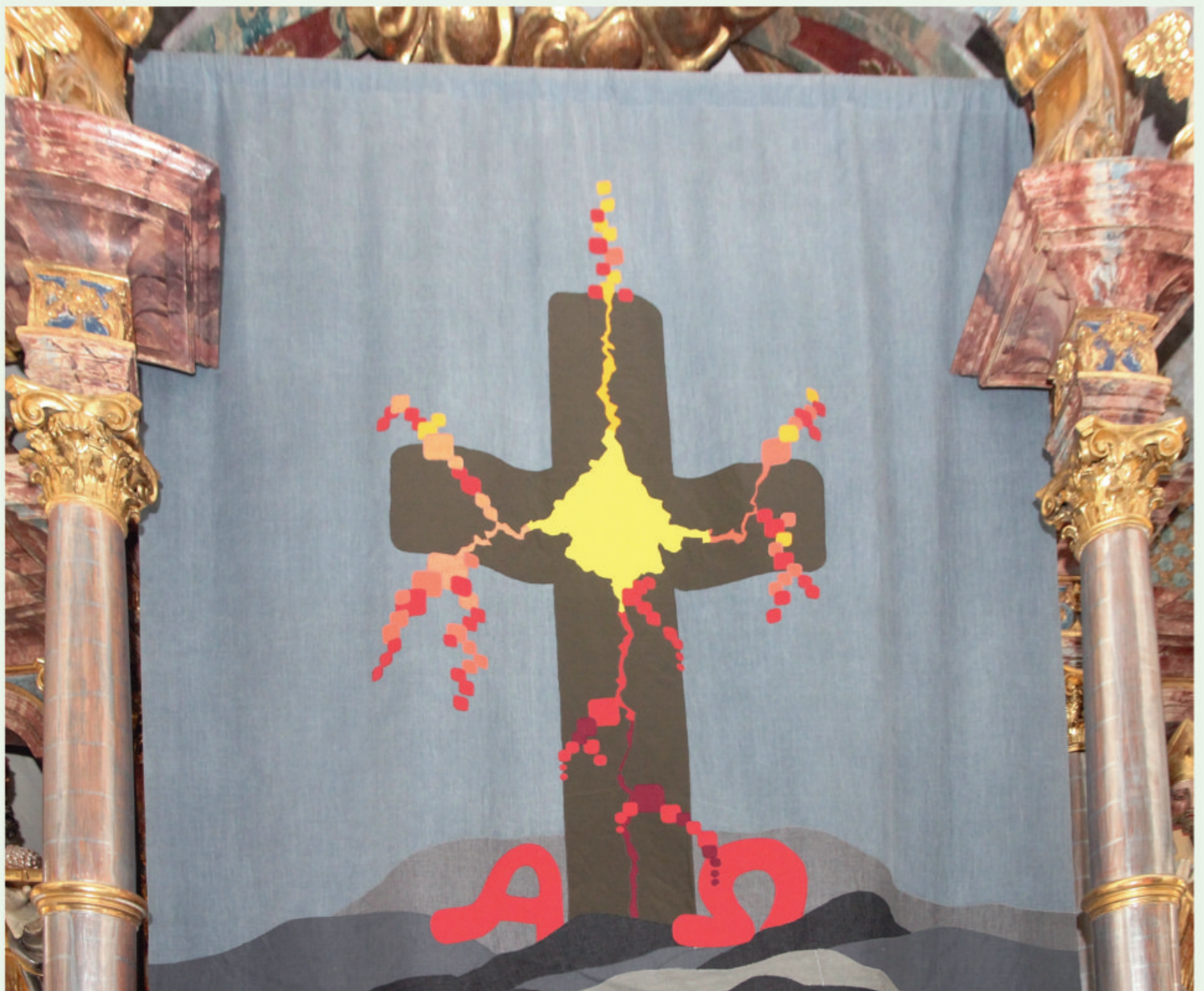
Pfarrkirche Steirisch Laßnitz, Fastentuch