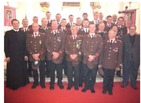
Florianijüngernach der Messe