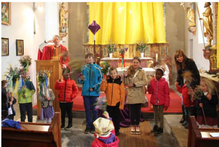
Kinder huldigen Christus mit den Palmzweigen Palmsonntag 2014