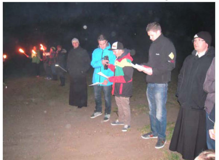
Gebet der LJ Zeutschach