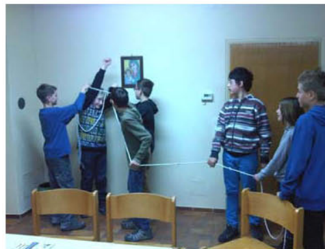
Teamgeist erleben in der ersten Firmstunde