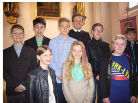
Tauferneuerungsgottesdienst in Perchau