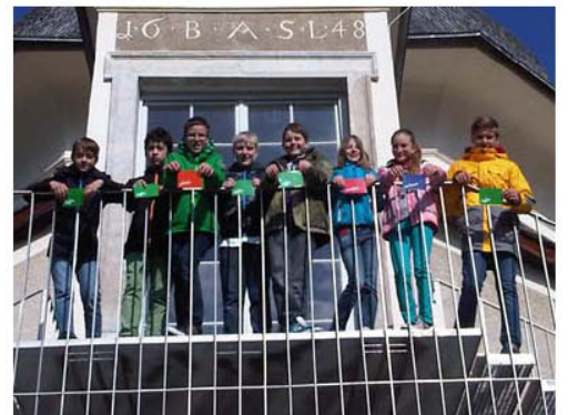
Firmtage im Stift St. Lambrecht