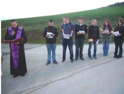
Kreuzweg der LJ Perchau am 11. April 2014