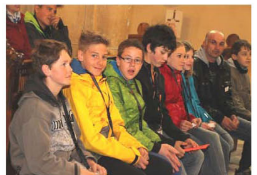
Spirinight mit über 380 Jugendlichen im Stift