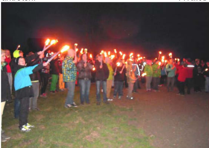
Fackelzug der Jugendlichen zu den einzelnen Stationen des Kreuzweges durch die Ortschaft Zeutschach