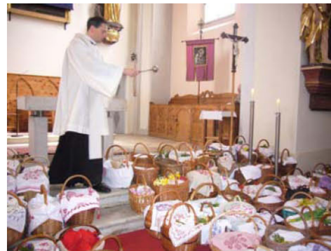
Osterspeisensegnung am Karsamstag 2014