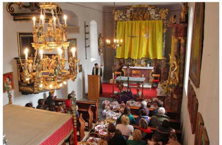
Osterspeisensegnung in Zeutschach am Karsamstag 2014