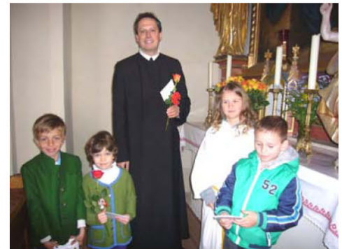
Erstkommunionkinder verteilen Blumen am Muttertag