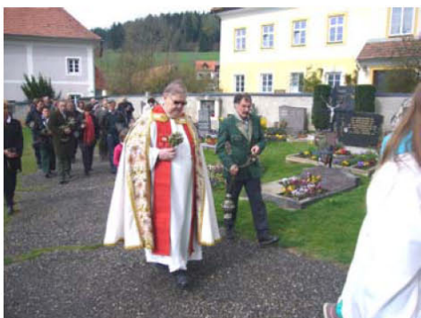
Einzug am Palmsonntag in die Pfarrkirche