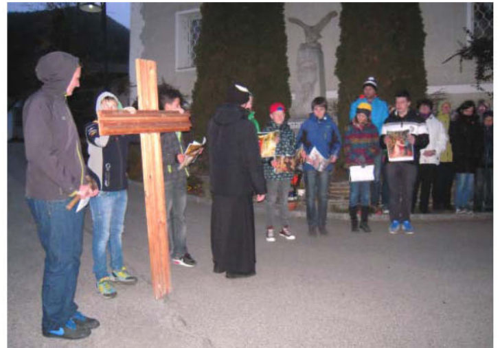
Station der Lambrechter Firmlinge