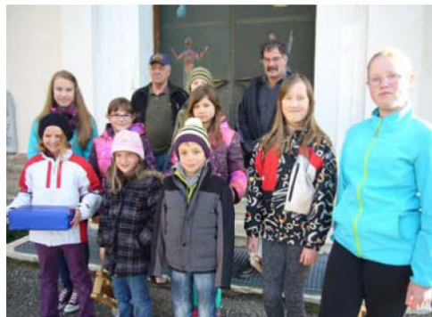
Unsere Ratschenkinder unterwegs im Ort