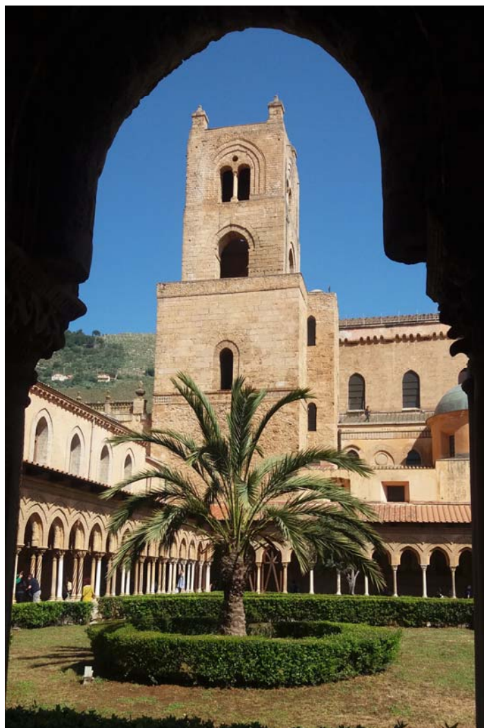
Monreale mit dem Kreuzgang

So verliefen die Fahrten in den Westen und Norden der Insel recht kurzweilig. Aber auch die zu dieser Jahreszeit explodierende und üppige Vegetation erfreute unser Auge und ließen die vielen Kilometer vergessen. Ein informativer Spaziergang durch das „Tal der Tempel“ in Agrigento, ein Besuch der mittelalterlichen Stadt Erice auf dem Gipfel des Guiliano Berg und eine Weinverkostung in Marsala mit äußerst fröhlichem Ausgang waren Höhepunkte der Tage 4 und 5.