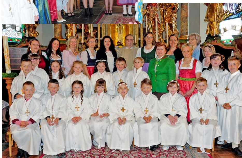
und das Gruppenbild

Seit Beginn des Jahres bereiteten sich die Erstkommunionkinder auf dieses große Fest vor. Bei Jesus sein – ja er ist mit uns und will das Leben mit uns teilen.