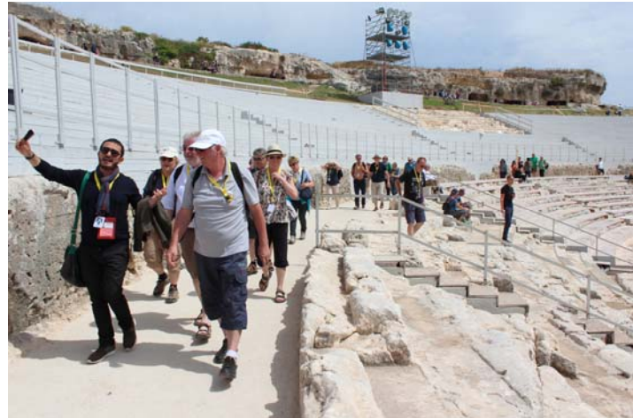
Gut geführt ..

für seine herrliche Akustik und sein vielfaches Echo, sang unsere Gruppe den Kanon „lobet und preiset, ihr Völker, den Herrn“. Mit lautem Beifall anderer Besucher wurde unsere Gesangseinlage belohnt.