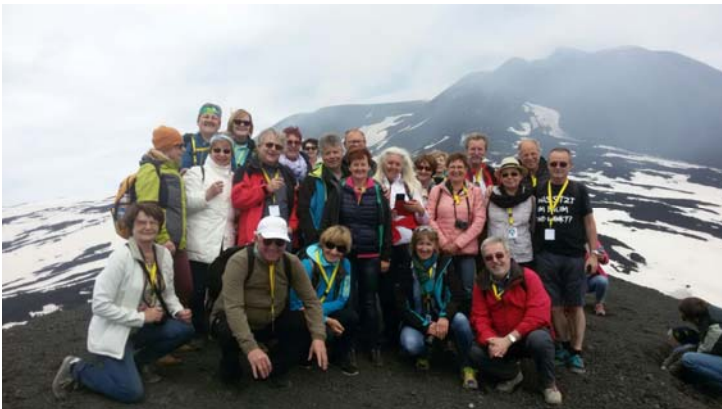
Wanderung zum Ätna

In den Reiseunterlagen von Moser Reisen stand: „Sizilien, die größte Insel im Mittelmeer, besticht durch ihre besondere Lage am Schnittpunkt zwischen Europa und Afrika einerseits, sowie westlichem und östlichem Mittelmeer andererseits. Dies ermöglichte eine außergewöhnliche historische Entwicklung und führte zu einer Verschmelzung der Kultur und Geschichte zwischen Griechen, Römern und andern Völkern wie Arabern, Byzantinern und Normannen. Sizilien überrascht seine Besucher nicht nur mit einem facettenreichen Landschaftsbild und dem höchsten Vulkan Europas, dem Ätna, sondern auch mit Meisterwerken der Weltarchitektur und grandiosen historischen Stätten und Ausgrabungen...“