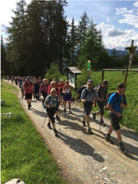
Bei der heurigen Fußwallfahrt hat sich dieser Spruch wieder einmal bewahrheitet.