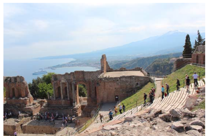
Taormina mit dem Amphitheater