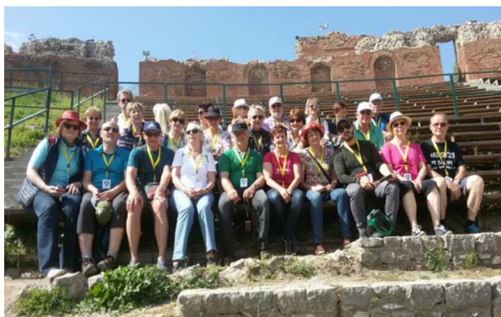
Die Gruppe bei wohlverdienter Rast

verabschieden. Sein unkompliziertes Wesen und seine humorvolle Art, Wissen zu vermitteln, werden uns lange in Erinnerung bleiben. Am darauffolgenden Tag besuchten wir das zauberhafte Fischerstädtchen Cefalu mit seinen engen und romantischen Altstadtgassen, die zum Verweilen und Genießen einluden. Im berühmten Normannendom begrüßten wir den Marienmonat Mai mit einem innig gesungenen Marienlied, in dem auch die Bitte um eine gesunde Heimkehr nach Österreich mitschwang.