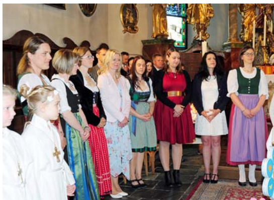
Die Gruppenmütter - Wegbegleiter unserer Kinder