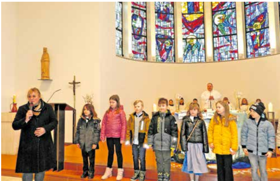
Beim Verlassen der Kirche verteilten Ministranten Zettel für Gebetspatenschaften der Erstkommunionkinder.

Nach der Erneuerung des Taufversprechens der Kommunionkinder mit ihren Paten und Patinnen, empfing eines der acht Kinder, das noch nicht getauft war, das Sakrament der Taufe.