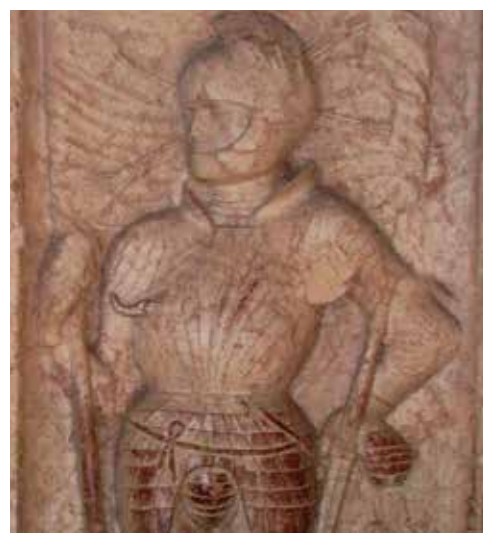
7. Dezember 1515

Siegmund von Eibiswald findet in der Kirche seine letzte Ruhestätte.