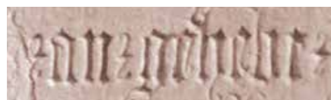
23. April 1513

Graf Niclas von Geisrucker wird am St. Veiter Friedhof begraben.